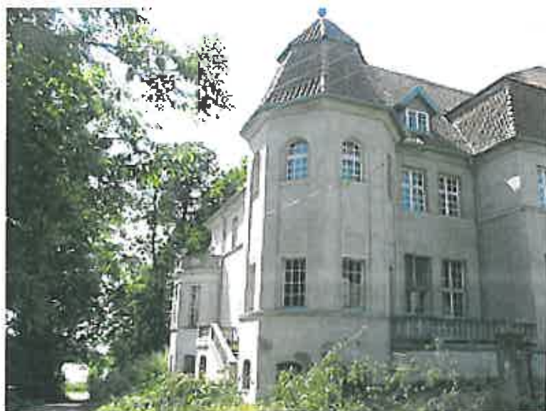
Fot.3 Pałac w Białej Oleckiej

(obecnie nie ma już na nim śladów po nagrobkach). Pozostała tylko piękna aleja lipowa. W dworku mieściło się przedszkole. Była także stołówka dla pracowników PGR-u i biuro księgowości. Przez jakiś czas istniał też klub wiejski. Na piętrze dworku urządzono zaś mieszkanie. Po likwidacji PGR-u gospodarstwo dzierżawiła prywatna spółka. Obecnie dworek jest własnością prywatną. Niestety obiekt coraz bardziej niszczeje.