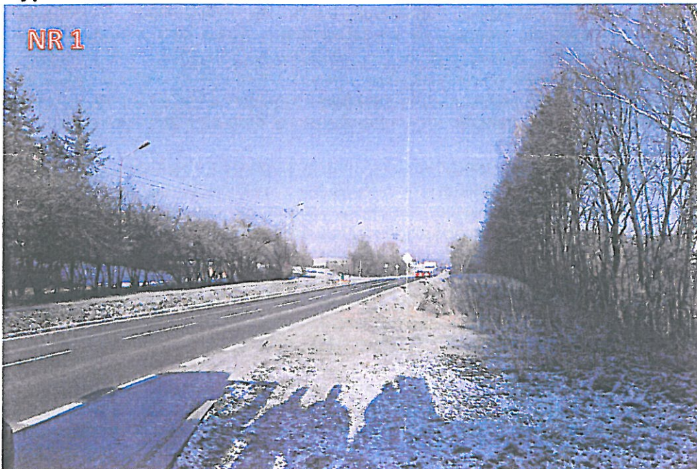
Widok ulicy Ełckiej w kierunku Ełku (obwodnicy Olecka).

Dojście do zatoki (przystanku) odbywa się gruntowym poboczem na długości ~100m. Mając na uwadze istniejące oznakowanie (lokalizację obszaru zabudowanego) wnioskujemy o przesunięcie obszaru, tak aby swoim zasięgiem obejmował wskazane miejsce przystanku i dalsze skrzyżowanie do którego doprowadzony jest chodnik po przeciwnej stronie drogi – jak wskazano na zdjęciu nr 2.