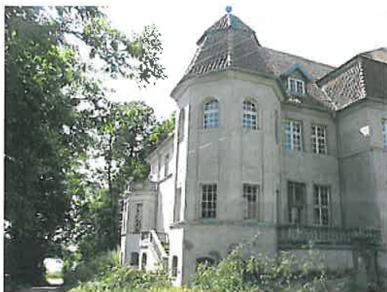
Fot.3 Pałac w Białej Oleckiej

(obecnie nie ma już na nim śladów po nagrobkach). Pozostała tylko piękna aleja lipowa. W dworku mieściło się przedszkole. Była także stołówka dla pracowników PGR-u i biuro księgowości. Przez jakiś czas istniał też klub wiejski. Na piętrze dworku urządzono zaś mieszkanie. Po likwidacji PGR-u gospodarstwo dzierżawiła prywatna spółka. Obecnie dworek jest własnością prywatną. Niestety obiekt coraz bardziej niszczeje.