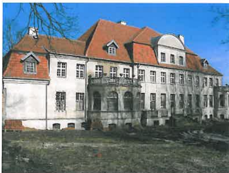
Fot.4 Pałac w Białej Oleckiej

Biała Olecka - dawny zespół pałacowo-parkowy z elewacją frontową zwróconą na północny zachód i rozległą częścią gospodarczą, położony około 14 km na północ od Olecka. Pięknie