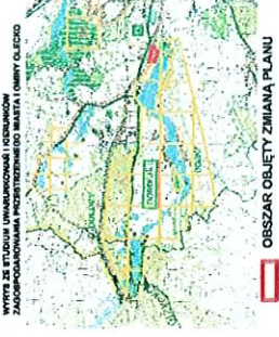
WYKAZ ZŁOŻENIA UMARZONYCH LICZBNIÓW ZAGOSPODAROWANIA PRZESTRZENNEGO MIASTA I GMINY OLECKO