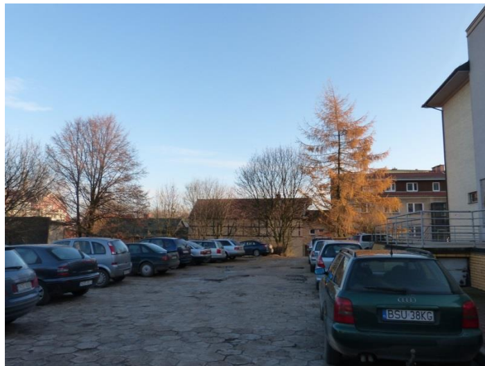
Fot. 2 Teren parkingów na tyłach domu kultury