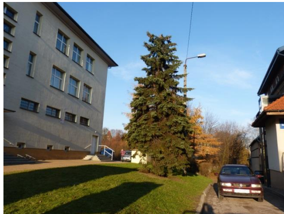
Fot.6 Drzewa wzdłuż ul. Stromej w bliskim sąsiedztwie szkoły muzycznej, zabudowy mieszkaniowej i warsztatu samochodowego odgradzonego trwałym murem oraz Regionalny Ośrodek Kultury

Użytkowanie terenu z niewielkim udziałem roślinności spowodował małą różnorodność i liczebność zwierząt. Poza tym fauna obszaru planu jest nie rozpoznana.