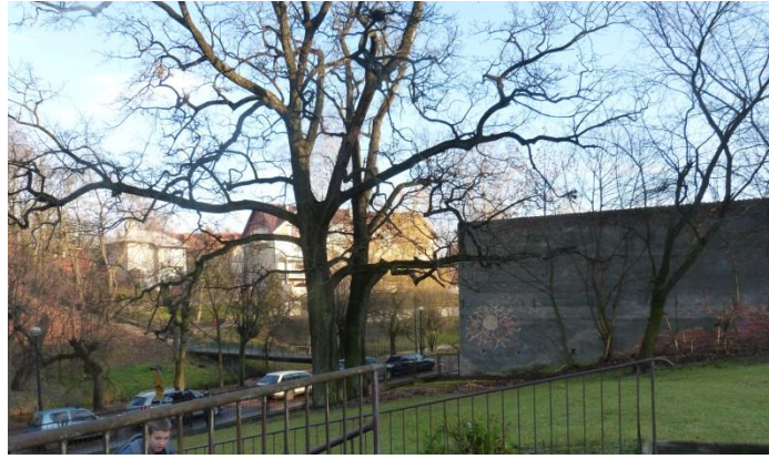
Fot.5 Dęby stanowiące pomnik przyrody, poza teren planu ok. 10m od granic planu przy ul. Partyzantów