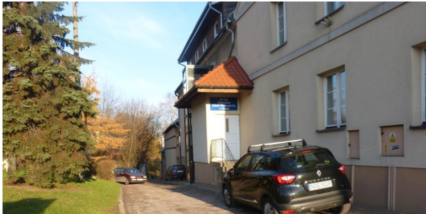
Fot. 1 Położenie terenu opracowania w bezpośrednim sąsiedztwie szkoły muzycznej, zabudowy wielorodzinnej i warsztatu samochodowego oddzielonego od drogi murem.

Teren planu położony jest w zabudowie śródmiejskiej o różnych funkcjach. Znajduje się tu zabudowa wielorodzinna, szkoła, ośrodek kultury, warsztat samochodowy, drogi, ścieżki, tereny zielone (bulwary nadrzeczne), rzeka. Przewidywana funkcja zamierzona w planie jest tożsama z istniejącą i jest tylko jej uzupełnieniem. Istniejący warsztat samochodowy nie stanowi zagrożenia dla funkcjonujących obiektów i nie stanowi zagrożenia dla planowanych. Położenie terenu planu i jego sąsiedztwa, zilustrowana fotografiami 1, 2, 3, i ryc.2, które pokazują śródmiejskość terenu o różnych funkcjach podobnych do zamierzonych zmianą planu.