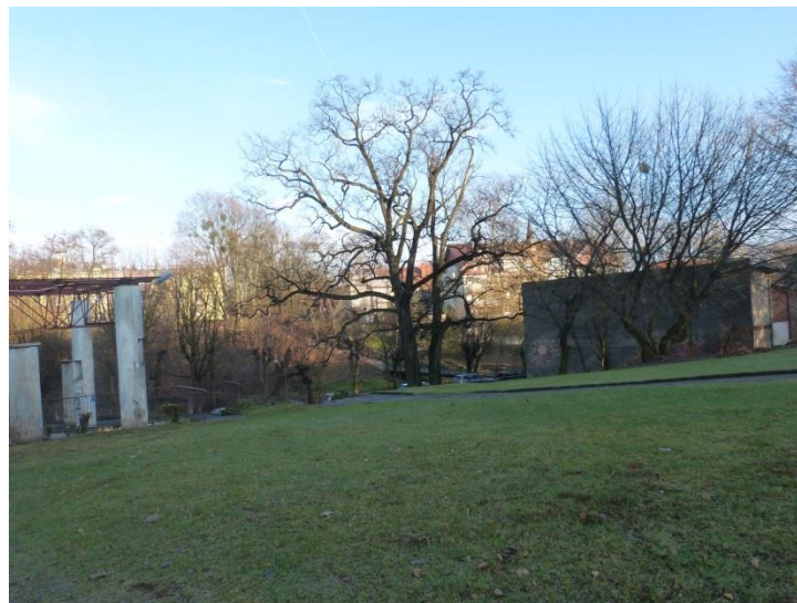
Fot. 4 Tereny zielone (trawniki) terenu, drzewa przydrożne wzdłuż ul. Stromej i Partyzantów

Walory biocenotyczne na obszarze planu, kępy zarośli oraz szpalery drzew występujące wzdłuż dróg.