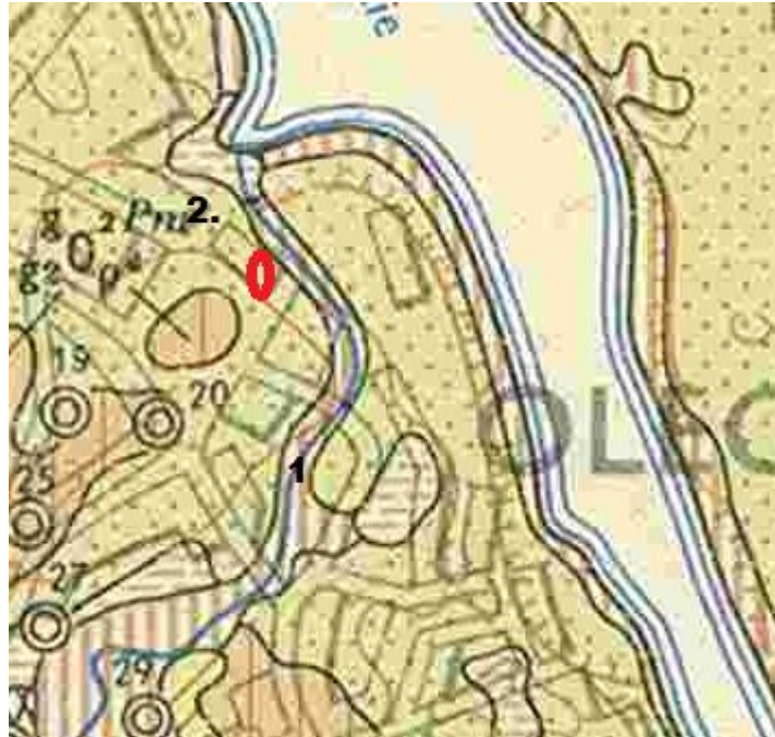
Ryc.3 Szczegółowa mapa geologiczna Polski, ark. 107-Olecko

wysegregowane. Miąższość od 1,0 do powyżej 4,5 m. stanowią grunty nośne o nośności uzależnionej od stopnia zagęszczenia gruntów (ryc. ).